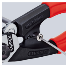
напрессовка наконечника на боуденовский трос