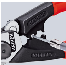
напрессовка концевой гильзы на тяговый трос